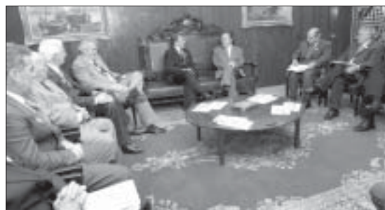
O senador José Sarney, então presidente do Senado, primeiro parlamentar a receber a diretoria da SBOT , se comprometeu a dar atenção especial ao Projeto quando for à votação no Plenário da Casa.

Nota da redação: Até o fechamento desta edição o PL 3466/04 não havia entrado em votação no plenário da Câmara dos Deputados.