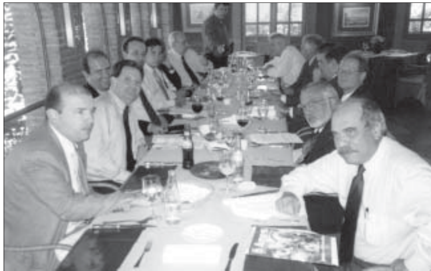
A expectativa das lideranças e parlamentares que aderiram ao Projeto é que o assunto seja incluído na pauta de votação do plenário da Câmara dos Deputados na primeira quinzena de abril.

Os membros da diretoria executiva da Comissão de Ética e Defesa Profissional da SBOT e lideranças médicas da SBOT, AMB e CFM reuniram-se com deputados federais, em Brasília, no último dia 15 de março, com objetivo de conscientizá-los da importância da votação em regime de urgência do Projeto de Lei 3466/04 que viabiliza a implantação da Classificação Brasileira Hierarquizada de Procedimentos Médicos .