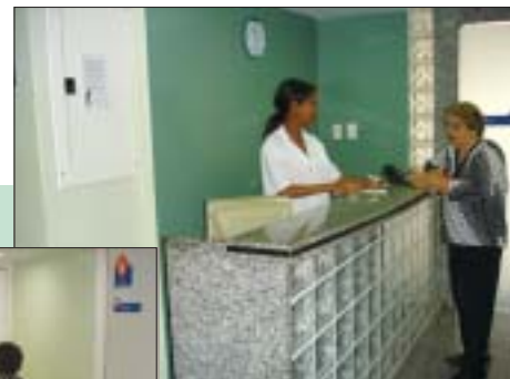
Recepção da AMOT