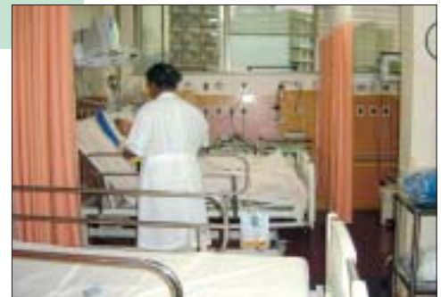
Centro de Terapia Intensiva