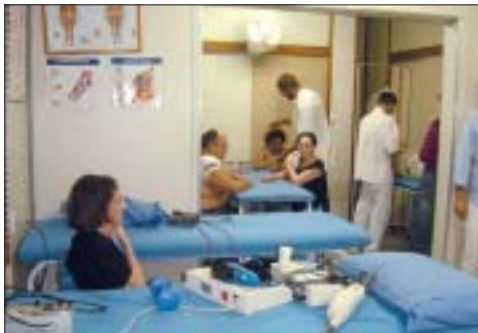
Fisioterapia de membros superiores