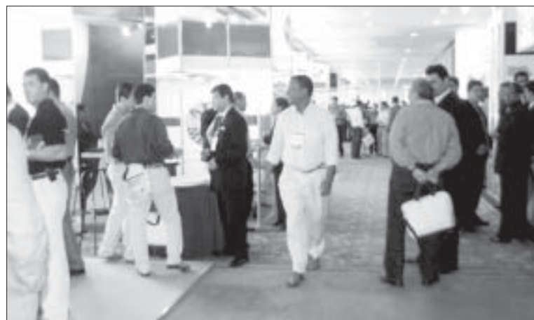
A Comissão Organizadora do Congresso ofereceu aos congressistas uma programação científica de qualidade e um pólo de informação e atualização.

A afirmação é do presidente da SBOT/RJ, Pedro Ivo de Carvalho. Pelo terceiro ano consecutivo o Rio de Janeiro foi sede do III Congresso Internacional de Artroplastia realizado no Sheraton Rio Hotel, de 15 a 17 de julho, onde reuniu importantes nomes da Ortopedia e Artroplastia brasileira e internacional.