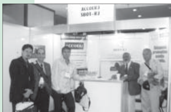
Stand da ACCOERJ: ponto de encontro dos ortopedistas, que receberam brindes distribuídos pela entidade.