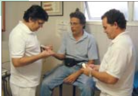
Sala de gesso