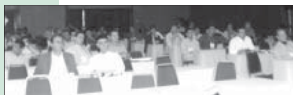
Ortopedistas debateram alternativas para resgatar a dignidade profissional do médico brasileiro.