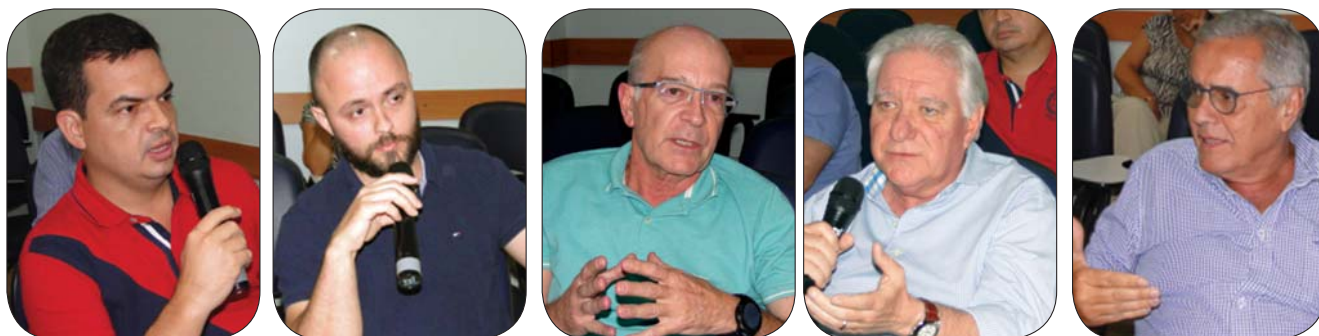
Na ocasião, os médicos debateram e discutiram a Resolução nº 2.227/2018 do CFM que incentiva o recurso à Telemedicina e autoriza a Teleconsulta .

Reportagem Tania Maria de Oliveira , assessora de comunicação da ACCOERJ